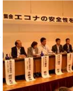
消費者団体が開いた会合 花王側は安全に問題ないと なぜ言い切れるのかと意見 相次ぐ 9/25都内

ss談 特保の商品でこの結果は、心配ですね、安全性を甘く受け止めてはいけません。