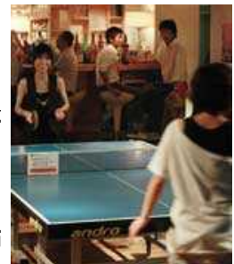
くつろいだ雰囲気のあるバーで卓球が出来る「中目黒卓球ラウンジ 中目黒本室」

卓球をしながら、見ながらお酒が飲める。そんな「卓球バー」がじわりと広がり始めている。誰もが一度はプレーしたことがあるある卓球は、実はみんなで手軽に楽しめる便利なコミュニケーションの道具と言える。景気悪化でカネをかけた格好良さが少し疎ましく見える世の中。自宅の一室のようなバーで酒を飲みながら、飾らずに素が出せる卓球は、うってつけの娯楽と認知され始めている。