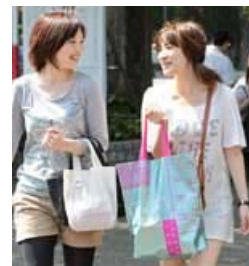
「シヨ袋」をセカンドバッグに （東京都台東区の上野公園）