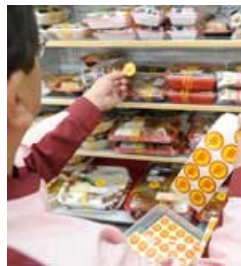
弁当に値引シールを張る 店員（19日、川崎市内）