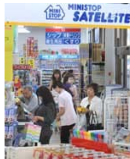
ドラッグストア内にコンビニが入った新業態も登場（埼玉県本庄市のグリーンシア・ミニストップサテライト本庄朝日町薬局）