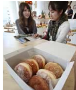
「カフェ フラハワイ」のマサラダ (横浜市)