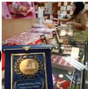
2008年モンドセレクション最高金賞を受賞した如水庵の筑紫もち (福岡市博多区の如水庵博多駅マイング店)

お名前は何度か聞いたことがありますよね！！ 私は、何度も“モンドクサマセレクション”を受賞したことがあります？？ 本当にあるのかな？？！！