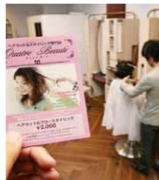
一律2000円・20分でカットできる手軽さが人気 (東京・有楽町のキャトルポータ)

株価が不安定、商品の値上げ等で生活は、中々厳しいですね。そんな中、暮らし密着のサービスはとて、ありがたいですね！！ “クサマ”は、お客様密着のサービスをいたします。