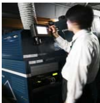
映写機のデジタル化によって編集作業が容易になり人件費削減が見込まれる（新宿ピカデリー）