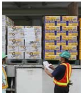
麒麟ビールとサッポロビールの商品を一緒に積み込むトラック（北海道千歳市の麒麟ビール千歳工場）

燃料費による物価上昇など価格が上がっていますよね。上がっていないのは、私のお小遣いだけ？？！！