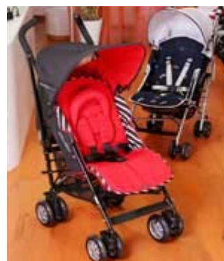
マクラレンのベビーカー (東京都港区)

夏本番！！ アイスが旨い時期ですね！ プールの後とかに食べると 絶品に美味しくお代わり したくなりますね！！！！