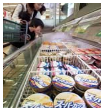
「スーパーカップ」が並ぶ売り場 (東京都世田谷区の サミットストア 芦花公園駅前店)