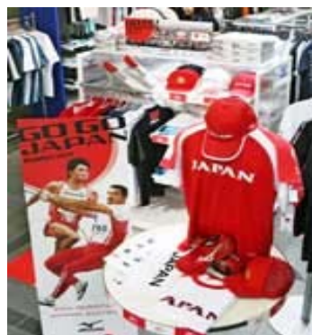
北京オリンピックに向け関連商品の展開に力を入れる（東京都千代田区のエスポートミズノ）

さていよいよ北京オリンピックが8月8日から17日間、中国で行われます。新記録を期待しながら見たいですね！！