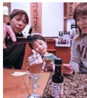
ソフトクリームに「醤油」をかける(石川県金沢市のヤマト醤油味噌)

一見合いそうにないけど、いざやってみると合ってしまう。そんな時ありますよね！！マヨネーズに御飯とかトマトケチャップにマヨネーズでサウザンアイランドになる？..それは私だけ？！