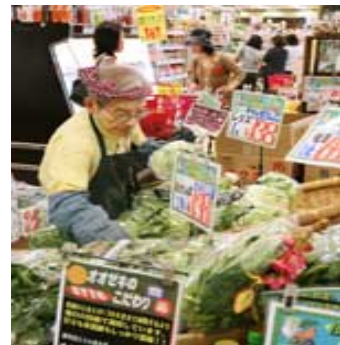
オオゼキは従業員の正社員率が高い (東京都世田谷区のオオゼキ松原店)

厳しい時代になりましたね！！ 消費低迷や原材料高があり消費者も大変ですね！！ 私の子供も食べ盛りなのでよく分かります。子供より父さんのが良く食べる??(メタボ注意!?)