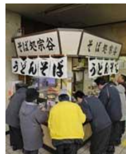
最北端の駅そば、 朝から常連客でにぎわう (北海道・JR稚内駅の「そば処宗谷」)