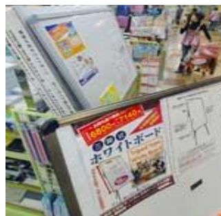
7000円台の商品も！ 東京・錦糸町の「ザ・ダイソー」 アルカキット錦糸町店）

いろいろ商品の値上げがあるため、日常生活でも、影響がでていますね。私の住んでいる田舎でも影響は、出ています。