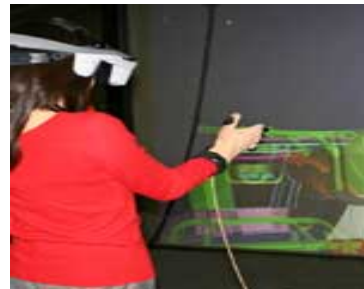
ヘッドセットを装着すると上下左右、見たい向きからみられる