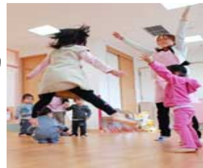
音楽に合わせて体操する子どもたち (神戸市中央区の神戸三宮キッズパルーン)