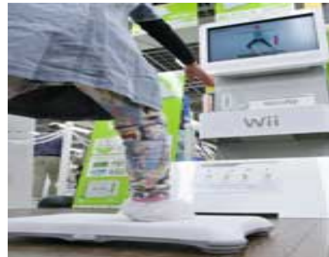
東の横綱は「Wii & DS」