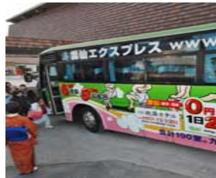
0円バス「雲仙エクスプレス」を見送る (長崎県雲仙市の東洋館)