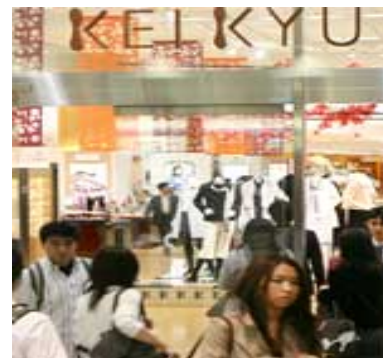
開業以来の連続増収記録が119カ月で途絶えた京急百貨店(横浜市港南区)