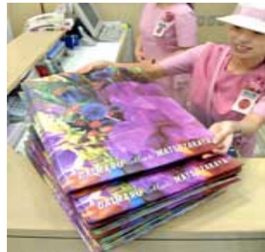
統合セール用の買い物バッグを作製 (丸の内の大丸東京店)