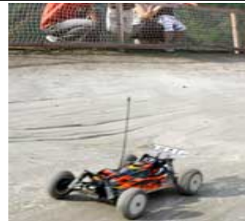
子供たちに浸透するか (石川県白山市)

百貨店も経営統合して、お互いの長所を生じて経営を進めていかななくては、ならなくなりました。どの業界でも、同じ現象が起きていますね!! 明日はわが身では、ありませんが地べたに、足をつけて慎重に行っていきたいですね!! 私は短足のため、地面にととても近いです!! (そういう問題ではない??? (笑))