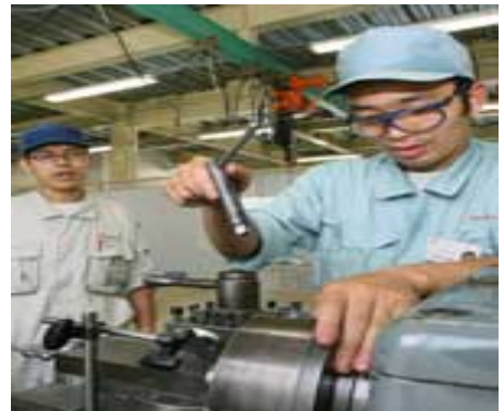
製造業に派遣するスタッフに旋盤の技術を教える (愛知県刈谷市のピープルスタッフ・テクニカルセンター)