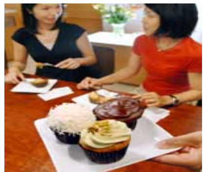
「リッティングヒル ケーキス&ギフト」では看板のマフィンよりカップケーキに反響（東京都港区）

とても、涼しそうですね。 天然クーラーみたいで自分の家でも、育てたいですね！！ ああそうだ！！！！自分の家は、周りが自然だからで、365日植物が”酸素”をだしていただけてます。一度遊びにきてください！！ 涼しいですよ！！（神奈川県茅ヶ崎市在中です。）