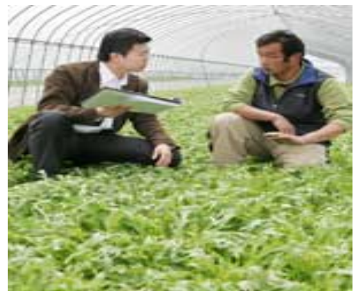
農作物を前に生産者(右)と話すJGAPの指導員(茨城県銚田市)

”タダ”と聞いて嫌いな人は、いないですよ 商品を確認するには、当然いいことですから！ 私も、実はサンプル大好き人間です 特に、お酒のミニチュワは…………… お酒は、おいしいですもんね！！