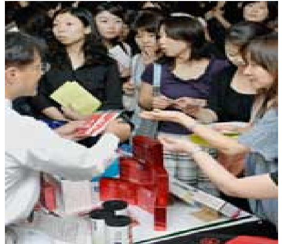
ルーク19は2カ月に1回、試供品をアピールするイベントを開催