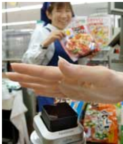
将来は手のひらをかざしてレジで精算できるかも（写真はイメージです）