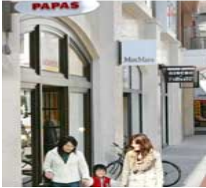
昨年オープンし再開発ビル「高松丸亀町老番街」(香川県高松市)

すばらしい計画です。 こんな町づくりができれば 老朽化している商店街もすばらしい ”まちづくり”になるでしょう。