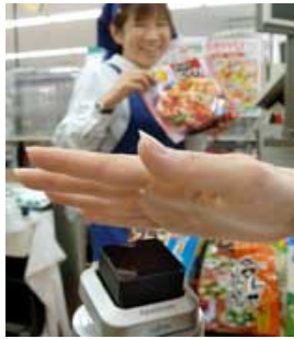
将来は手のひらをかざしてレジで精算できるかも（写真はイメージです）