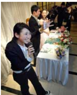
結婚式の2次会で場を盛り上げる幹事代行 (東京都港区)

忘年会や新年会シーズンを迎え、「幹事さん」は大忙しだ。とりわけ団塊の世代が定年退職を迎え始める2007年を控え、昔の仲間と旧交を温めようという人たちの間で同窓会ブームもさらに盛り上がりそう。そこで、お店選びや出欠確認など幹事業務の代行サービスが広がっている。店側との交渉も引き受け、通常より割安な料金を提供するケースもある。人の集まりに商機アリ当世「幹事さん」事情を探った。